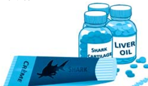
Cartilage et huile de foie : cosmétiques, médicaments