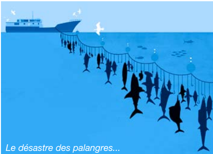
Le désastre des palangres...

Chaque année ce sont 100 000 tonnes de ces espèces non ciblées qui sont remises mortes à la mer, autant que la quantité de thon pêchée ! La pêche à la palangre étant la plus grosse source de gaspillage car ces lignes d'hameçons espacées dans l'eau tuent 7 à 8 requins par hameçon pour la pêche au thon et à l'espadon !