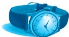
Peau : ceintures, montres

Stoppez votre consommation de thon en boîte. Elle concentre aussi mercure, arsenic, cadmium, néfastes à la santé humaine. La marque Petit Navire dépasse la valeur réglementaire de 1mg/kg de mercure, métal lourd dont les grands prédateurs marins concentrent les teneurs (notamment les requins et les thons...).