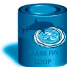
Ailerons : soupes